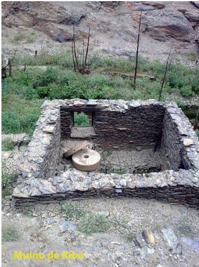
Muíño de Ribó

lugares anegados había casas, nas casas había familias, formadas por persoas de tódalas idades, a maior parte das terras estaban cultivadas; nos fornos cocíase o pan; nos hórreos gardábase o millo; os castiñeiros daban castañas; os carballos daban belotas; nos bancaís medraban as cepas, cargadas de ácios; nas adegas repousaban as cubas, e nas cubas durmía o viño.....A vida fervía en cada recuncho. Se recordamos o pasado o presente resulta tétrico. A vida é un raio de luz, a morte, a escuridade eterna. Cando volte ao nivel normal, voltará o anegamento, outros 48 anos. Velaí a importancia que teñen as fotos feitas neste lapso de tempo, que se adxuntan. Nun percorrido polas terras anegadas párome en